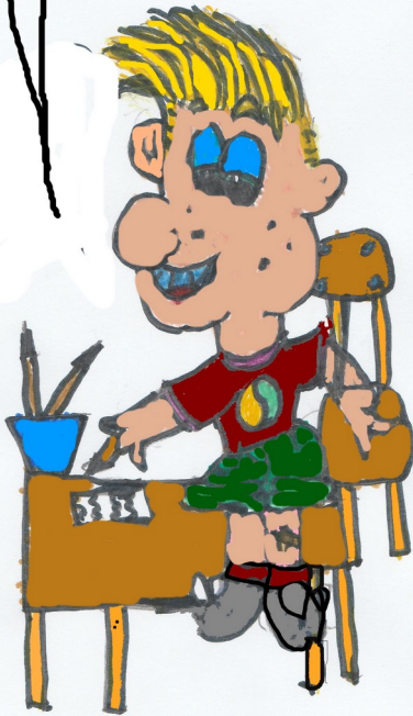
Maëlys Bonnefoy 6 e

La rentrée des 6 e du collège Notre Dame s'est bien passée. Beaucoup d'entre eux ont retrouvé leurs amis. D'autres étaient un peu nerveux mais impatients de rencontrer de nouveaux camarades.