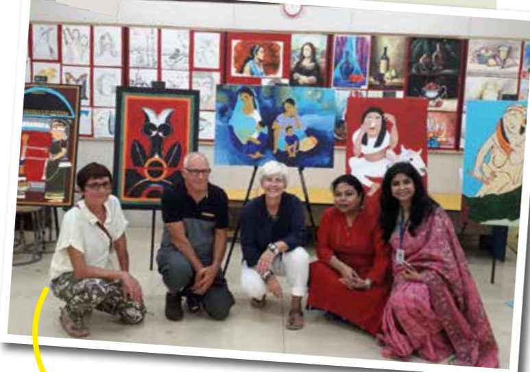
Les professeurs d'art en Inde avec nos accompagnateurs.

Ce qui m'a marqué : la pollution qui rend l'air difficile à respirer pour nous, Français. »