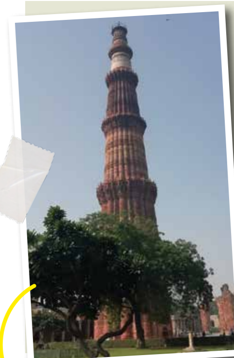
Le Qutb Minar : le plus haut minaret en brique du monde !