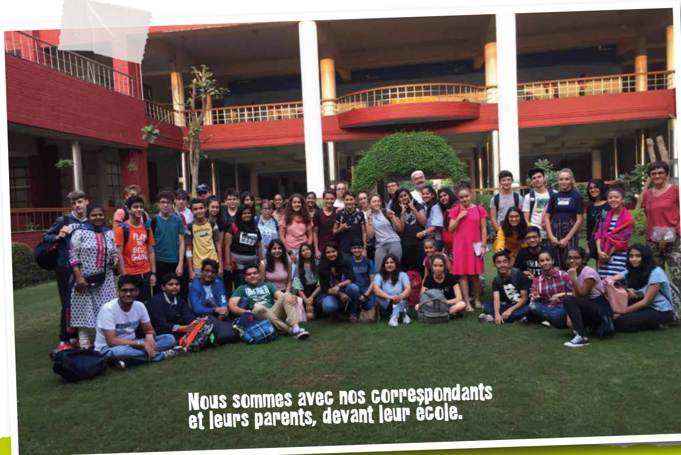
Nous sommes avec nos correspondants et leurs parents, devant leur école.